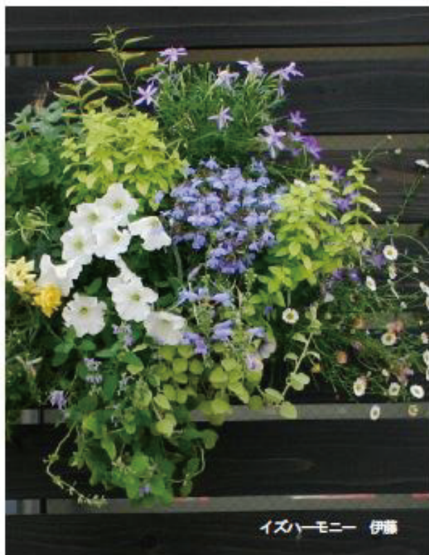
イズハーモニー 伊藤