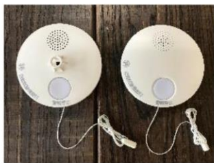
▲煙だけでなく、熱や炎を感知するものもあります。