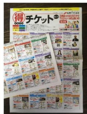
▲「柏商工会議所」発行のマルチケットに掲載。