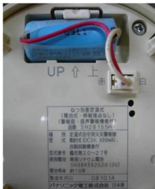
▲交換を依頼された商品の製造年は2008年でした。

義務付けられてから10年以上が経っていますので、皆さんのお家の火災警報器もそろそろ交換の時期がきているかもしれません。確認してみてくださいはいかがでしょうか。